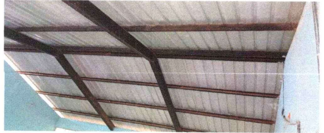
FOTO No. 2: Imagen interna de aula donde se puede observar la necesidad de cambio de estructura de metal.