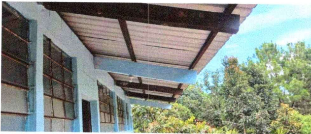
FOTO No. 3: Vista desde patio donde se puede notar la necesidad de cambio de techo y estructura metalica.