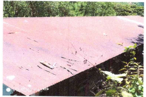
FOTO No. 4: Fotografia superior donde se puede ver el mal estado en que se encuentra el techo del modulo No 2 del establecimiento.

Observación: Si es necesario se pueden agregar hojas adicionales y actualizar el número de hojas.